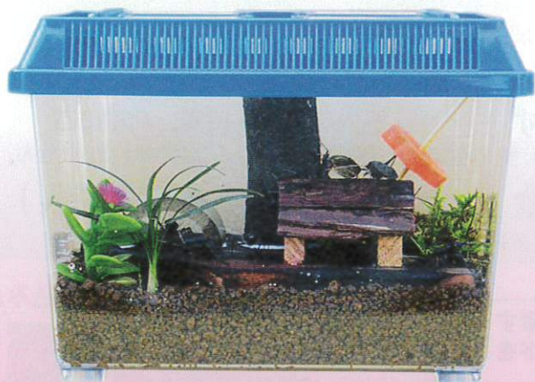
すず虫飼育セット (A)