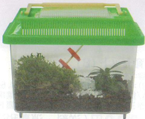
すず虫飼育セット (B)